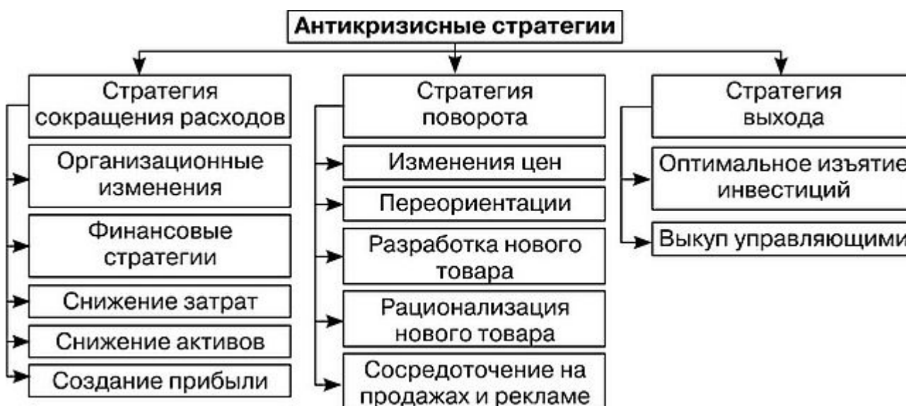
Рисунок 2. Классификация антикризисных стратегий

Толчком к изменениям являются кризисные ситуации. В зависимости от того, в какой области они представляют опасность для достижения целей предприятия, выбирается соответствующая антикризисная стратегия. Виды антикризисных стратегий представлены на рис. 2.